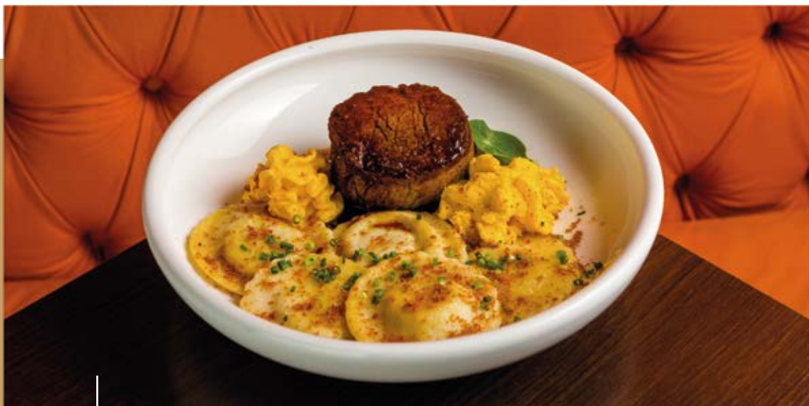
Filé mignon com ravióli de abobora, espuma de queijo, pó de bacon e molho demi glace.